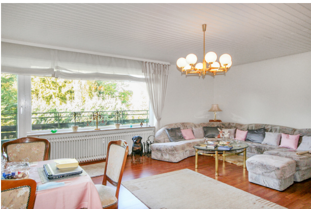
lange Fensterfront mit Zugang zum Balkon