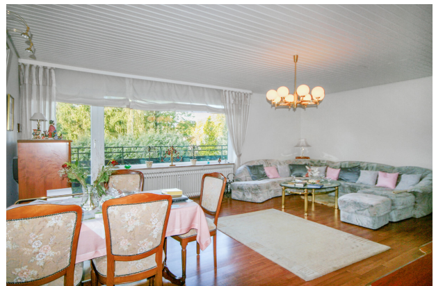
Platz für einen Esszimmertisch