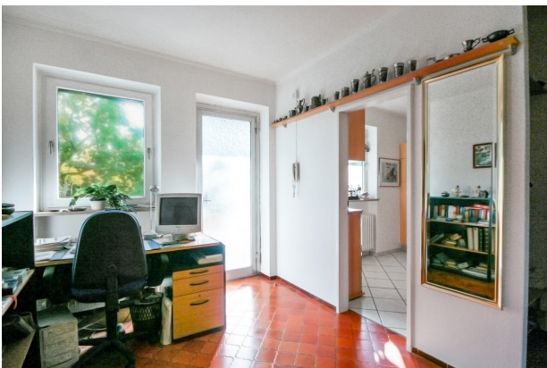
große Diele mit Platz für Büroecke