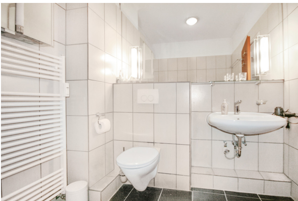
zeitlos und gepflegt