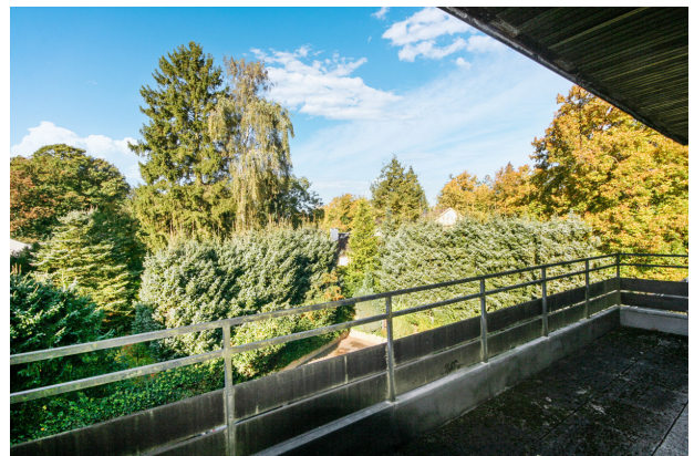
Blick ins Grüne