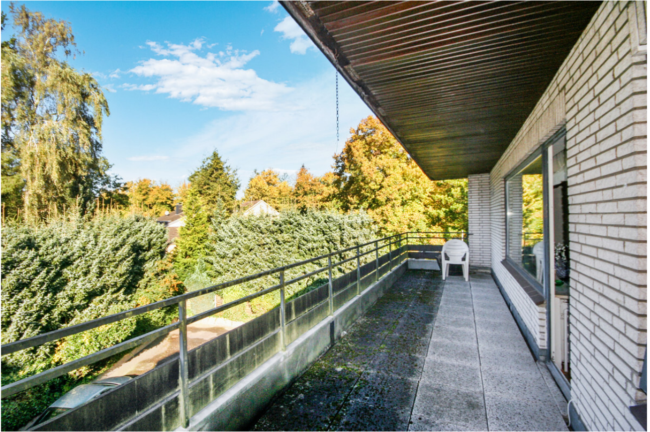
ca. 18 m 2 großer Balkon in Südwest Ausrichtung