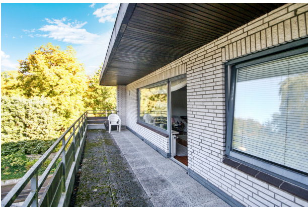
Bodenbelag und Geländer werden erneuert