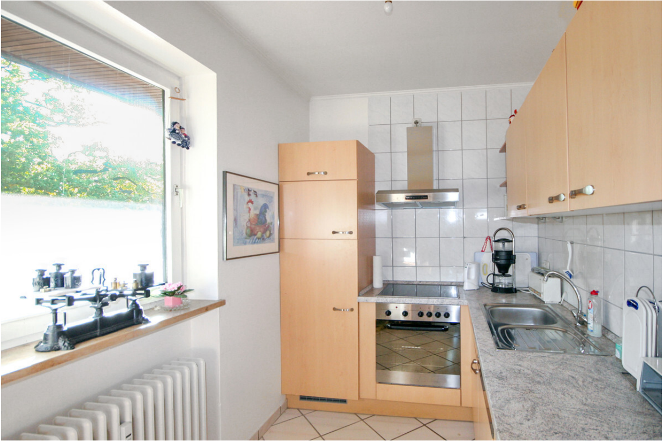
Einbauküche mit Fenster