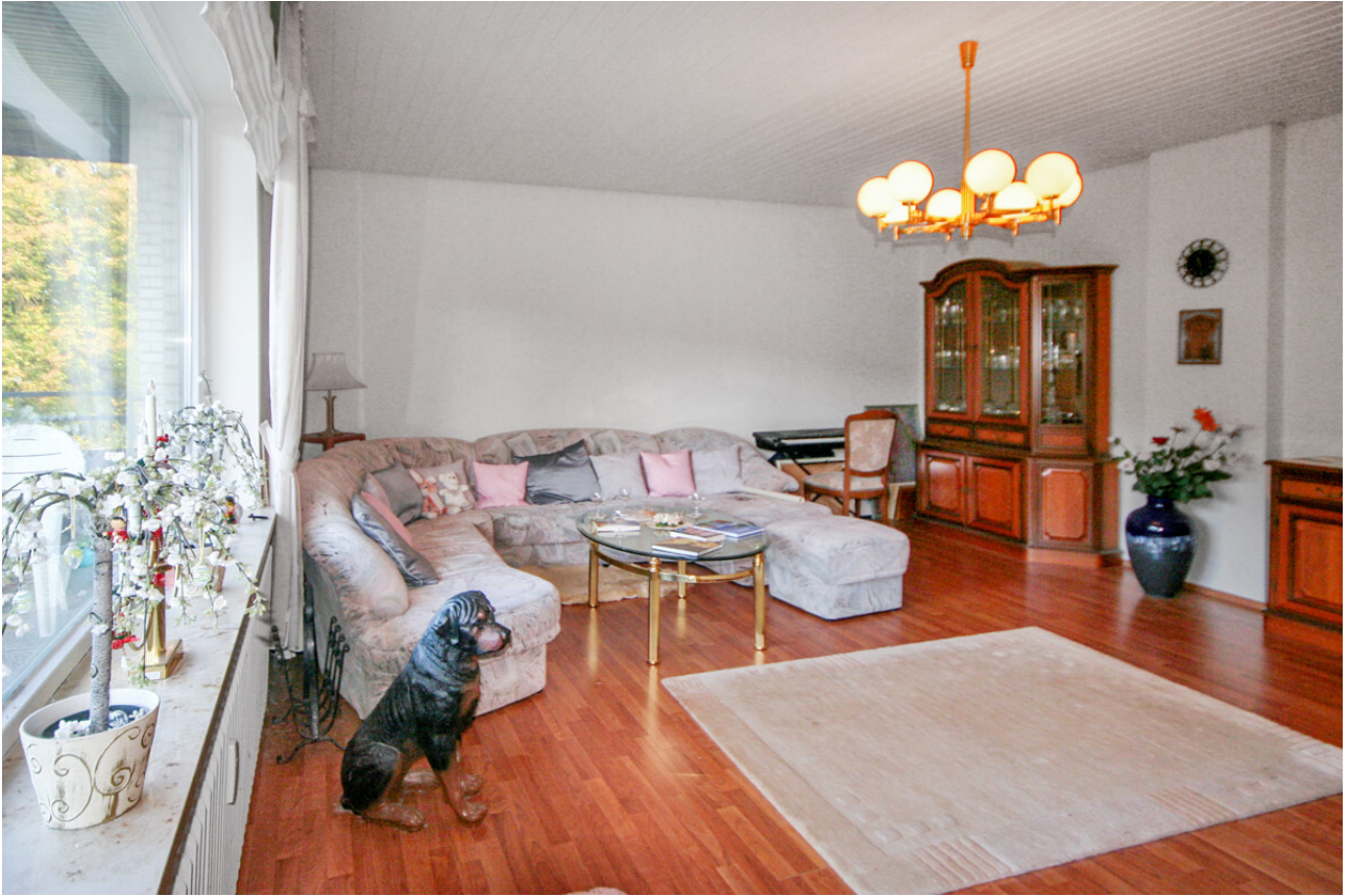
ca. 32 m 2 großes Wohnzimmer