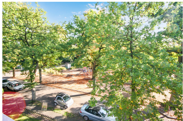
Blick in die Umgebung